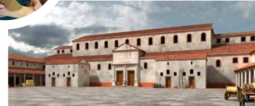
Im Archäologischen Museum lassen Ausgrabungsfunde (o. r.) und ein Modell der Basilika (u.) römische Vergangenheit lebendig werden. In Riegel sind Überreste eines Mithras-Tempel (o. l.) erhalten. Schuhmacher Uwe Berntatz (Kreis) fertigt Römersandalen und Gamaschen an.